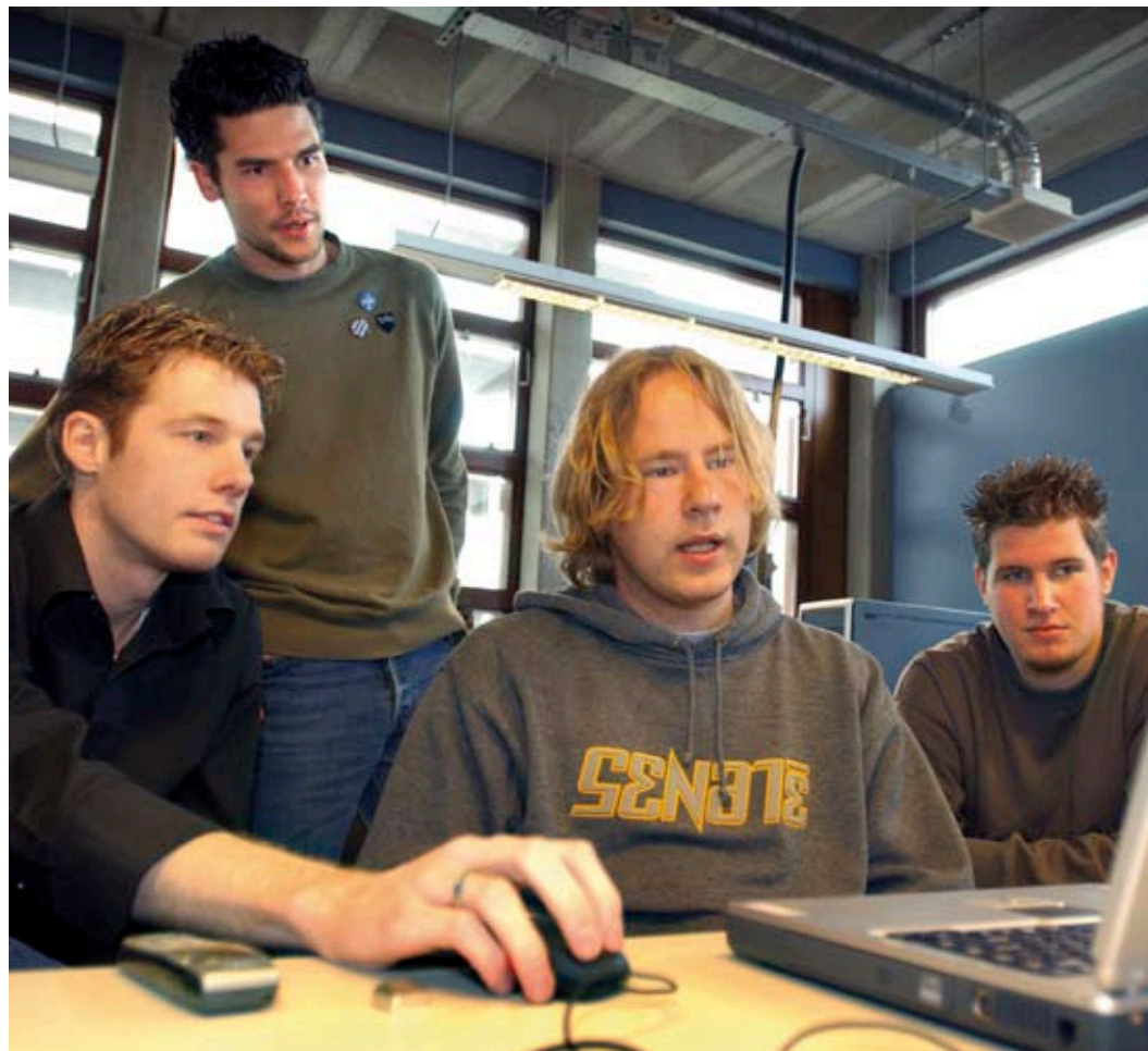
ICT studenten werken aan opdrachten uit het MKB

Hij noemt een voorbeeld. "Een op de zes MKB-bedrijven hier in de regio heeft last van 'cyber crime'. Een telecombedrijf in Nuth kwam met de vraag zijn computernetwerk door te lichten. Onze studenten hebben nu een scan uitgevoerd op de security van het netwerk en een rapport opgesteld met daarin een aantal verbetermaatregelen. Dit bedrijf was geholpen en wij hebben onze studenten weer even laten proeven aan de realiteit. We proberen ons onderwijs zo in te richten dat het dichtbij de praktijk staat en vinden het prachtig om studenten echte opdrachten van echte bedrijven voor te leggen, onder onze nauwlettende coaching natuurlijk. De studenten leren een stuk techniek, maar ook hoe om te gaan met een klant en hoe een project aangestuurd moet worden."