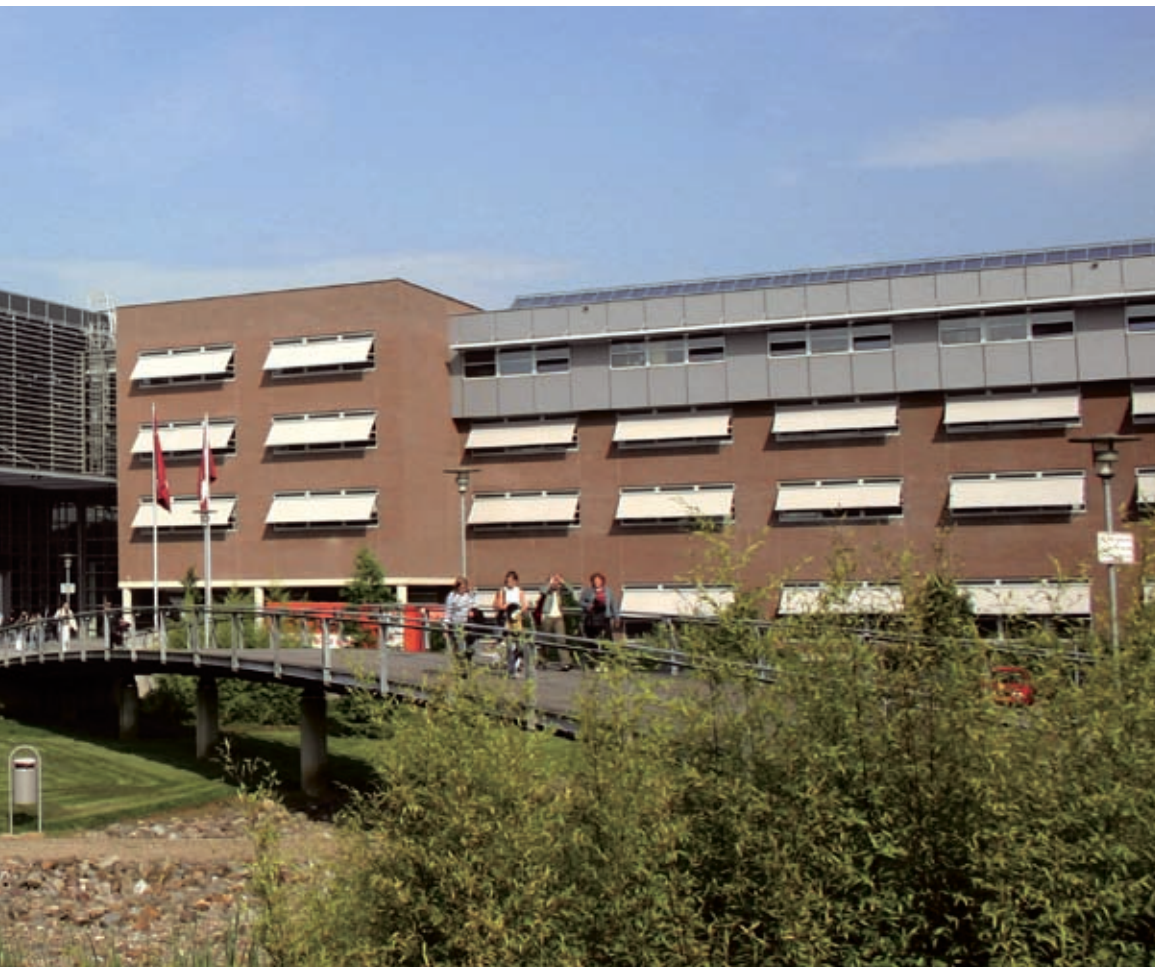
Hogeschool Zuyd, locatie Heerlen

VMBO samen een huis, van ontwerp tot uitvoering. Het bedrijfsleven doet met genoeg mee aan dit project. Voor de bouwwereld biedt het een mooie gelegenheid om toekomstige vakgenoten te werven. De opleidingen hebben er belang bij dat praktijk en theorie worden samengebracht." Het project 'de opleidingswoning' heeft de Regionale Innovatieprijs Beroepsonderwijs gewonnen. Een nieuw project dat op stapel staat is het bouwen van de eerste 0-energie woning, een huis dat evenveel energie levert als dat nodig is om erin te kunnen leven. "We gaan deze woning maken op het Avantis-terrein, samen met Duitse partners. Dit project is voor ons een grote uitdaging, want de eerste 0-energie woning moet in Limburg nog gebouwd worden. Nu, dat gaat dus gebeuren, met de medewerking van onze studenten!"