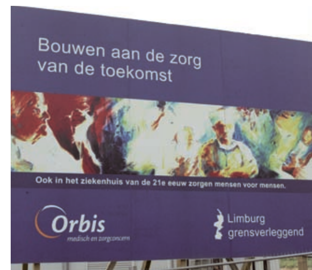
Bouwen aan de zorg van de toekomst

Hogeschool Zuyd is veranderd van een onderwijsinstelling naar een kennisinstelling. Kennis moet circuleren: van binnen naar buiten en andersom. De expertisecentra zijn als het ware de markten waar deze kenniscirculatie plaatsvindt.