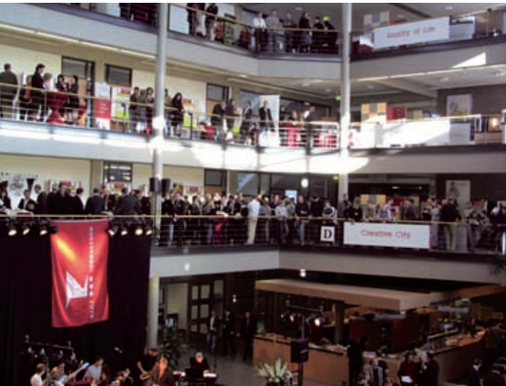
Hogeschool Zuyd 'Kennis in bedrijf'