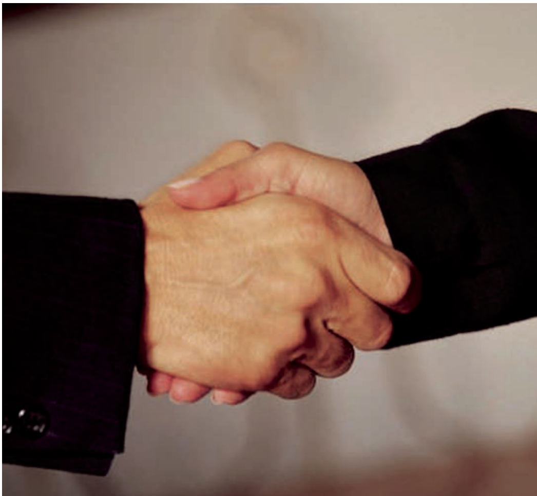
Natuurlijk partnership in een snel veranderende wereld

ziekenhuis te Sittard gewerkt aan het ziekenhuis van de 21e eeuw. Er komt een nieuw gebouw en ook de zorgverlening in het ziekenhuis wordt vernieuwd. "Patiënten gaan dit straks merken door een voor hen snellere, efficiëntere en prettiger dienstverlening." In het tweede innovatieproject wordt samen met de welzijnsorganisaties Trajekt en Wel.Kom gewerkt aan nieuwe werkwijzen om meer burgers vrijwillig actief te krijgen in de maatschappij. Het is de bedoeling dat hulpbehoevende mensen, bijvoorbeeld ouderen die dreigen te vereenzamen, door hun familie, buurtbewoners of vrijwilligers beter worden ondersteund. Voor de twee genoemde projecten is een half miljoen euro subsidie verkregen, vooral omdat ze een voorbeeldfunctie vervullen voor de rest van Nederland en het buitenland.